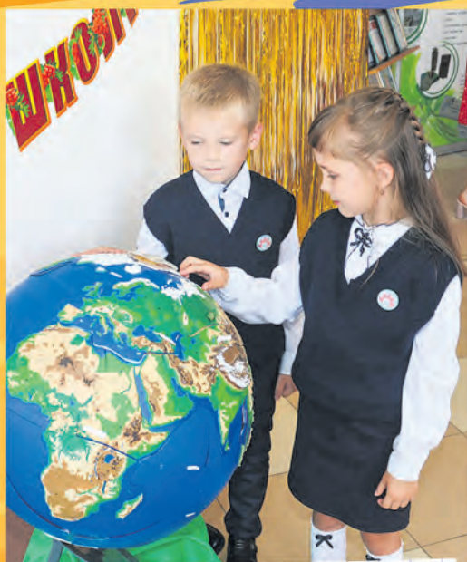
Автор фото: Вероника Степанчук, Гродненская обл.