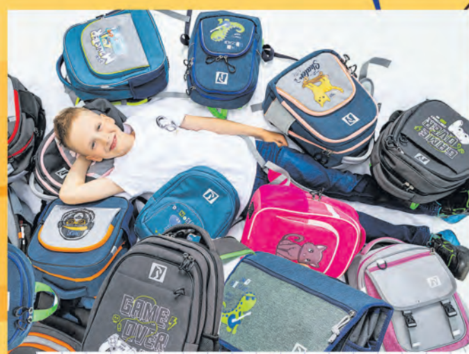
Автор фото: Елена Мишурко, Витебск