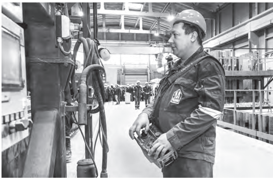
Слушателям презентовали опыт общественного контроля за соблюдением законодательства об охране труда на примере первички крупнейшего в стране строительного предприятия ОАО «МАПИД».