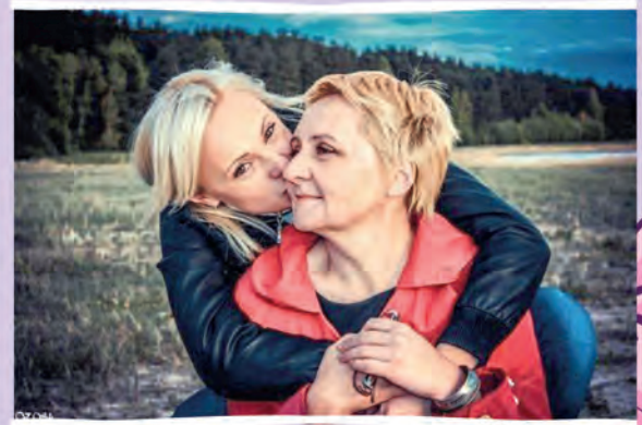
Автор фото: Олеся Нарель, Браслав