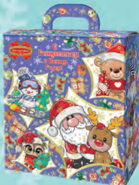
В искрах Рождества