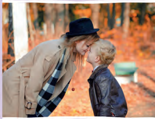
Автор фото: Мария Филиппова, Пинск