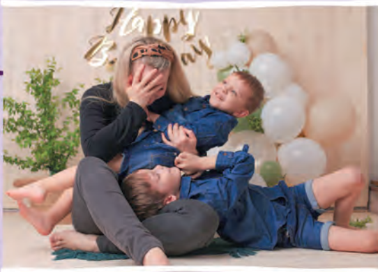
Автор фото: Марина Милашевич, Гродно