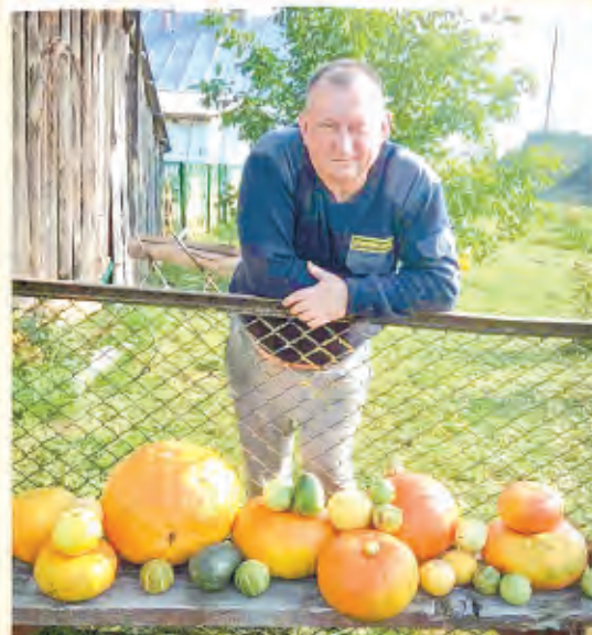
Автор фото: Владимир Жидко, Гродненская обл.