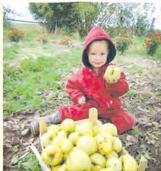
Автор фото: Светлана Окунева, Могилевская обл.