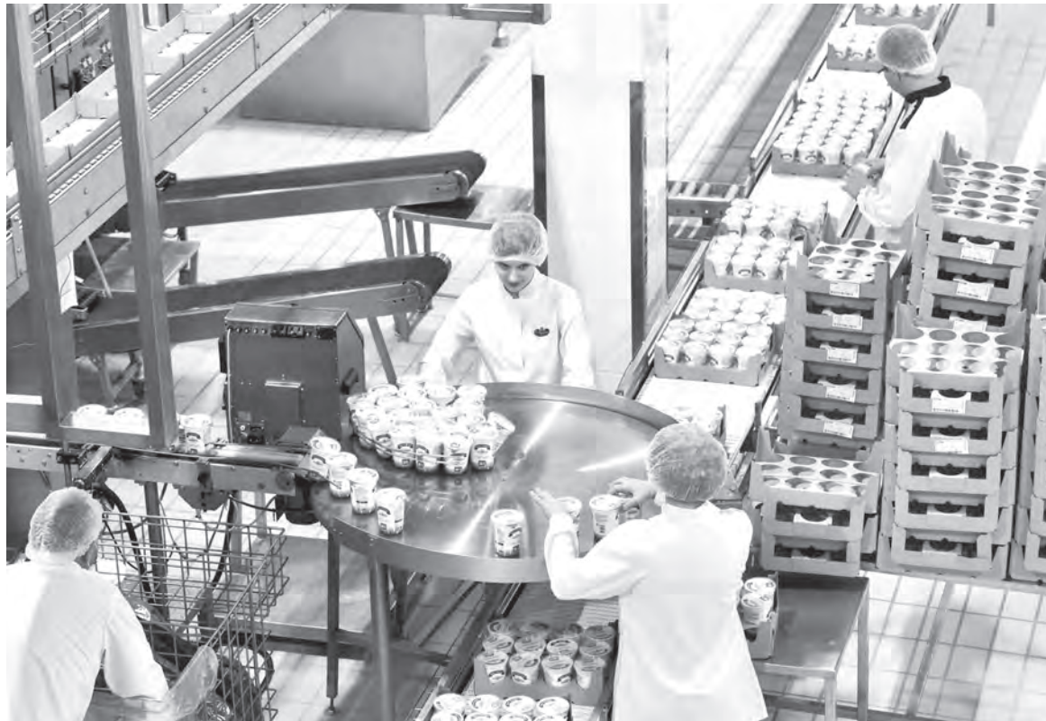
На всех перерабатывающих предприятиях региона работают медпункты. К примеру, в ОАО «Савушкин продукт» (на снимке) здравпункты оборудованы на производственных площадках в Бресте, Березе и Пинске, а в Барановичах и Иваново в штате есть фельдшеры.

В 2022-м в сельхозорганизациях Брестчины на работе скоропостижно скончались 7 человек, в этом году уже более 10. Так, в мае нынешнего года на рабочем месте умер мастер одной из организаций Березовского района. Ему было 65 лет. Не удалось реанимировать работника «скорой» и 58-летнего начальни-