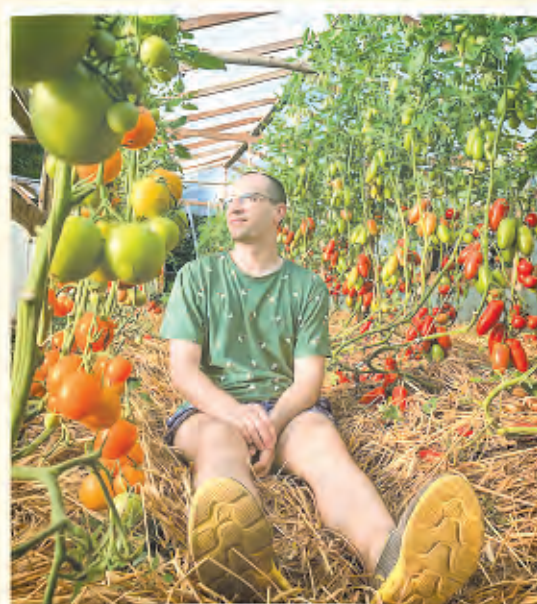
Автор фото: Юлия Калита, Минск