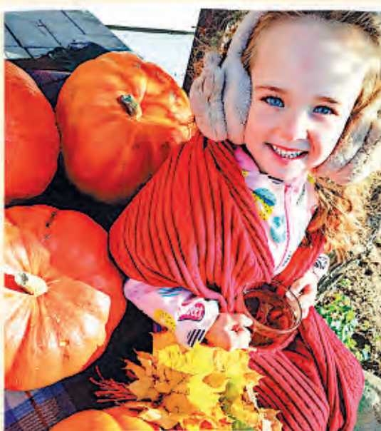
Автор фото: Мария Гончарук, Минская обл.