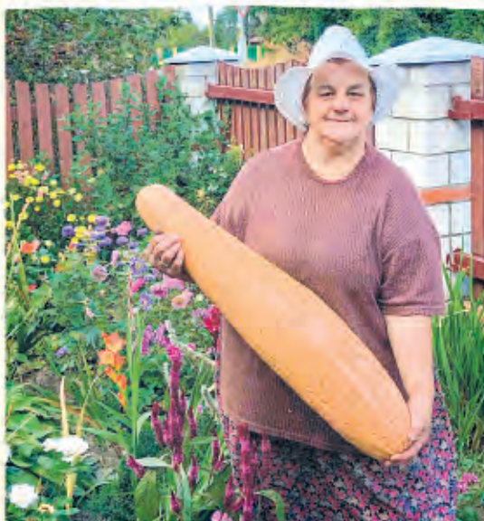
Гомельская обл.