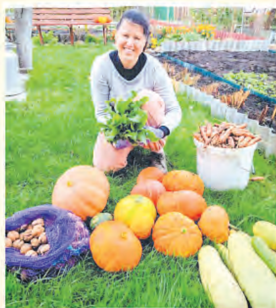
Автор фото: Дарья Тарасюк, Брест