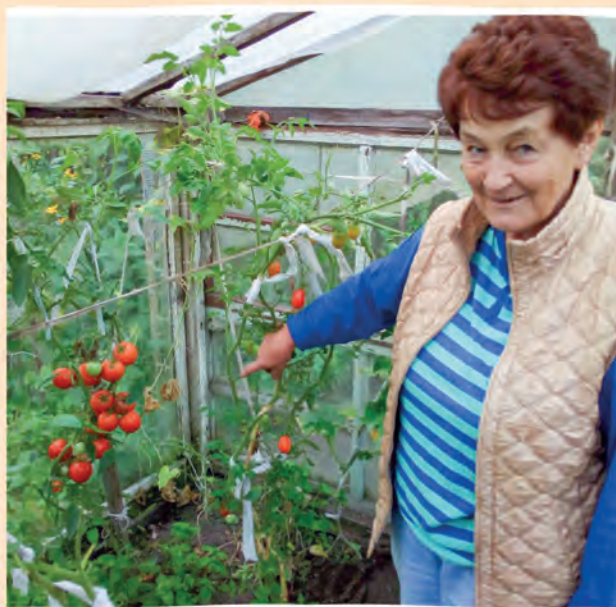
Автор фото: Валентин Смыков, Полоцк

Подробности конкурса на сайте belchas.1prof.by