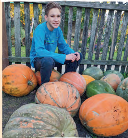
Автор фото: Наталия Сергиевич, Брестская обл.