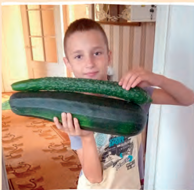
Автор фото: Ольга Капаевич, Пинский район