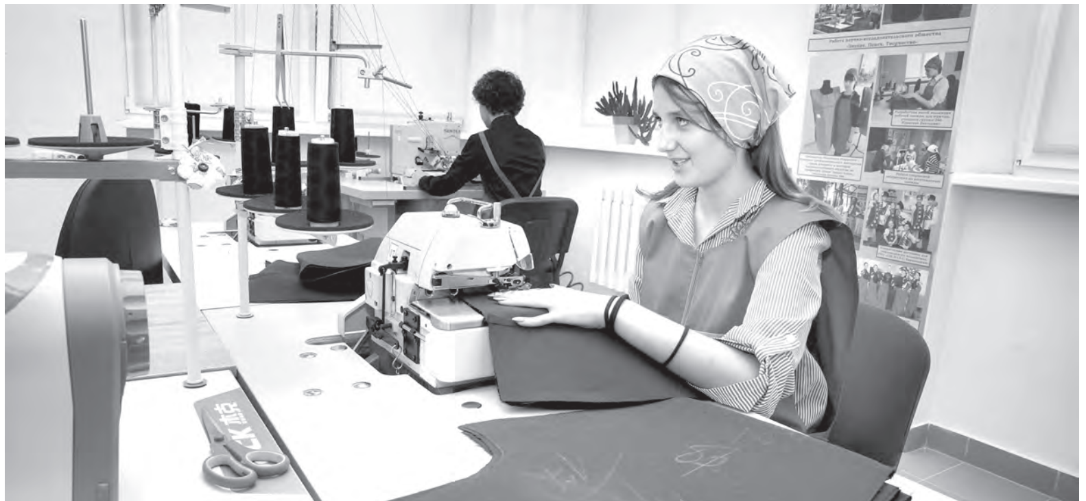
С 2019 года на базе Барановичского колледжа технологии и дизайна работает центр компетенций современных технологий в швейном производстве, где ежегодно более 800 учащихся области совершенствуют свои профессиональные навыки.

В Брестской области 46 колледжей, в которых рабочим специальностям обучают свыше 4 тыс. человек и еще 1800 дают среднее специальное образование. Спрос на рынке труда диктуют предприятия, а им остро необходимы операторы станков с ЧПУ,