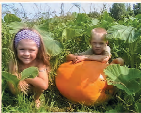
Автор фото: Александра Ананченко, Витебская обл.