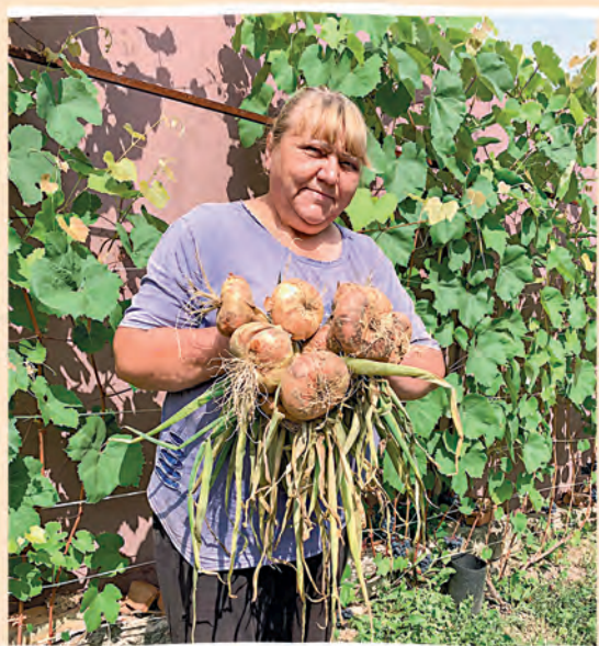
Автор фото: Валентина Магденко, Кричевский район