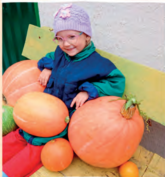
Автор фото: Вероника Нехороших, Орша