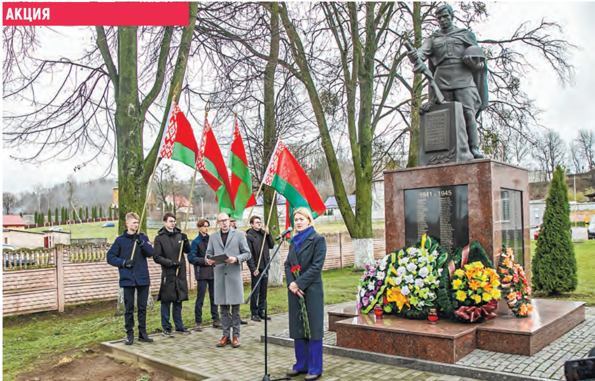
Митинг памяти у братской могилы в агрогородке Путришки Гродненского района.