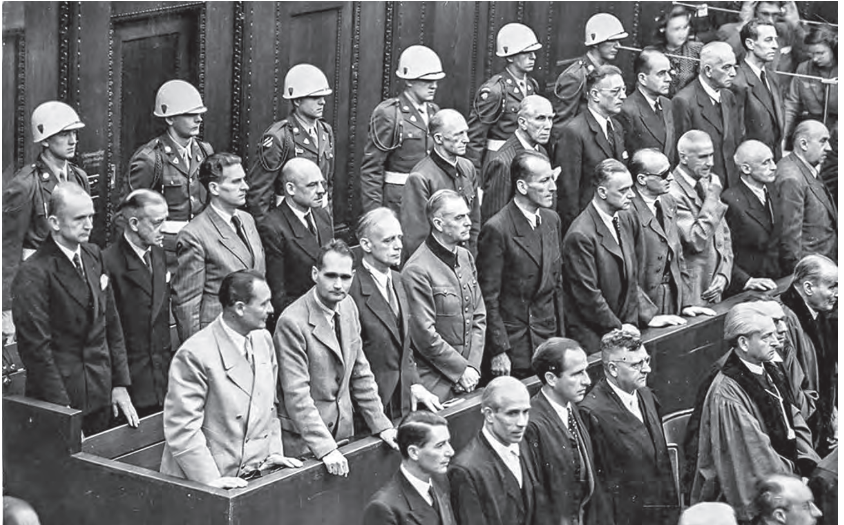
На Нюрнбергском процессе впервые в истории обвинялось руководство государства, а приговор вынесло мировое сообщество.

Пока нацисты были у власти и обладали силой, они совершили столько зверств в Германии и на оккупированных территориях, что им грозила расправа в духе «Собаке – собачья смерть». Примерно так и хотели поступить западные союзники по антигитлеровской коалиции. Но Советский Союз настоял на том, чтобы военно-политическую верхушку «третьего рейха» судили. Нюрнбергский процесс стал одной из самых значимых страниц международного права. И даже спустя 78 лет он не теряет актуальности.