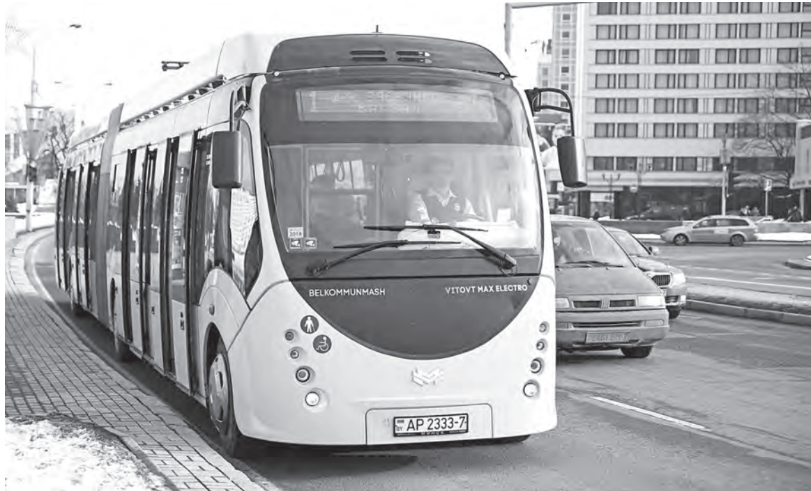
Белорусский электробус – тоже часть «зеленой» энергетики.

Это результат планомерной и продуманной политики, комплекса мер и новых подходов. Все эти годы в нашей стране масштабно занимались строительством газоочистного оборудования, развитием электротранспорта, переходом на экологически чистые виды топлива и сырья (в частности, отказ от озоноразрушающих веществ). Значительный вклад внесет БелАЭС.