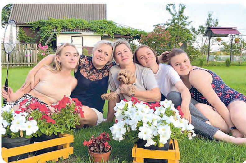
Автор фото: Татьяна Прончак, Барановичи