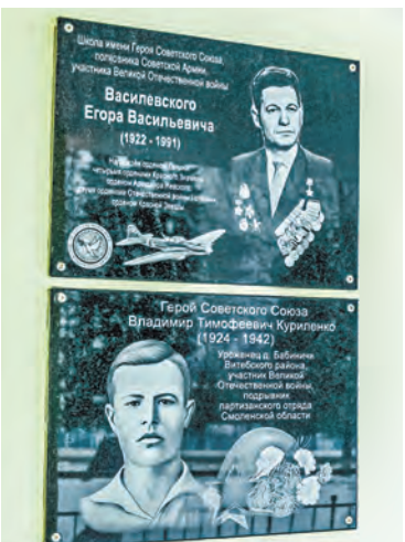
Два выпускника Бабиничской школы были удостоены звания Героя Советского Союза.