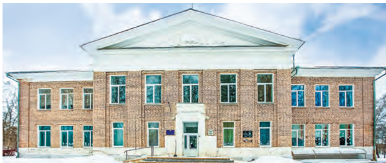
Здание школы, открытое в 1956 году.