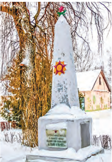
Памятник ученикам и учителям школы, отдавшим свою жизнь в боях в 1941-1945 годах.