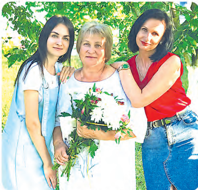
Автор фото: Ирина Адериho, Минская обл.