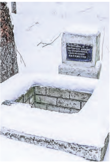
Колодец, в который фашисты сбрасывали замученных патриотов.