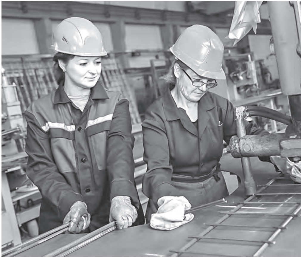
В разные годы силами бобруйских строителей в республике возводилось от 20 до 128 тыс. кв. м жилья.

В профсоюзах проходит отчетно-выборная кампания. В первичках подводят «местные» итоги и избирают своих лидеров.