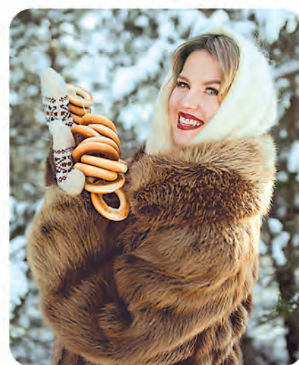
Автор фото: Елена Страленя, Копыль