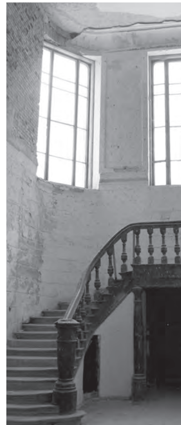
Старинная лестница ведет на второй этаж дворца.

– Дворец стал местом съемок нескольких фильмов. Самый знаменитый – первый белорусский хоррор «Масакра». Помню тот ажиотаж, который вызвал в 2010 году приезд артистов. Местным разрешили пройти на территорию, чтобы понаблюдать за съемками. В итоге там яблоку было негде упасть! Кроме того, дворец можно увидеть в детской ленте «Киндервилейское