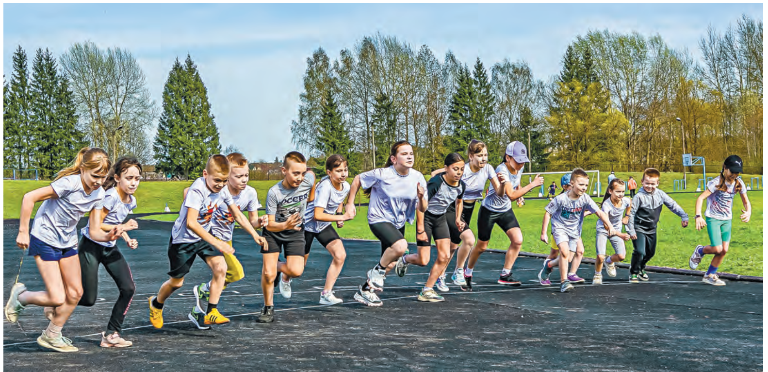
Бегом к новым победам. На старте – учащиеся секции легкой атлетики.

Все занятия в секциях – бесплатные. А вот экипировка и спортивный инвентарь – статья затратная, но с этим частично помогают школа и региональные