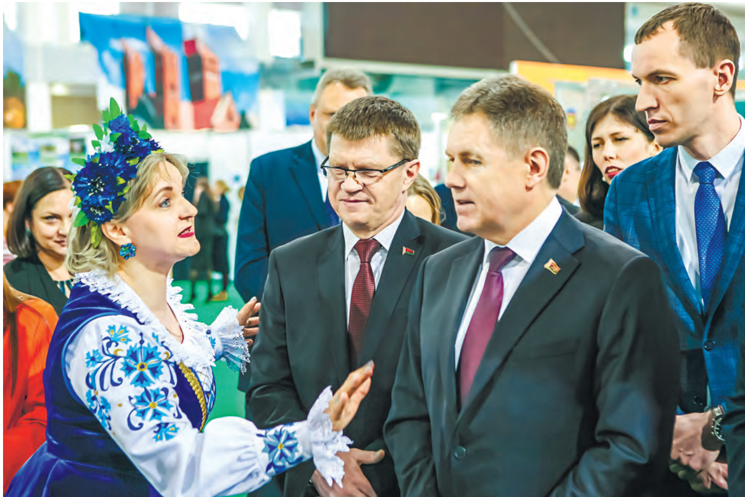
Заместитель премьер-министра Игорь Петришенко и председатель ФПБ Юрий Сенько ознакомились с экспозицией выставки-ярмарки «Отдых-2024».