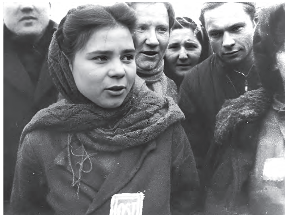
Девушка-остарбайтер с нашивкой «OST», освобожденная из лагеря содержания под Лодзью. Фото носит иллюстративный характер.