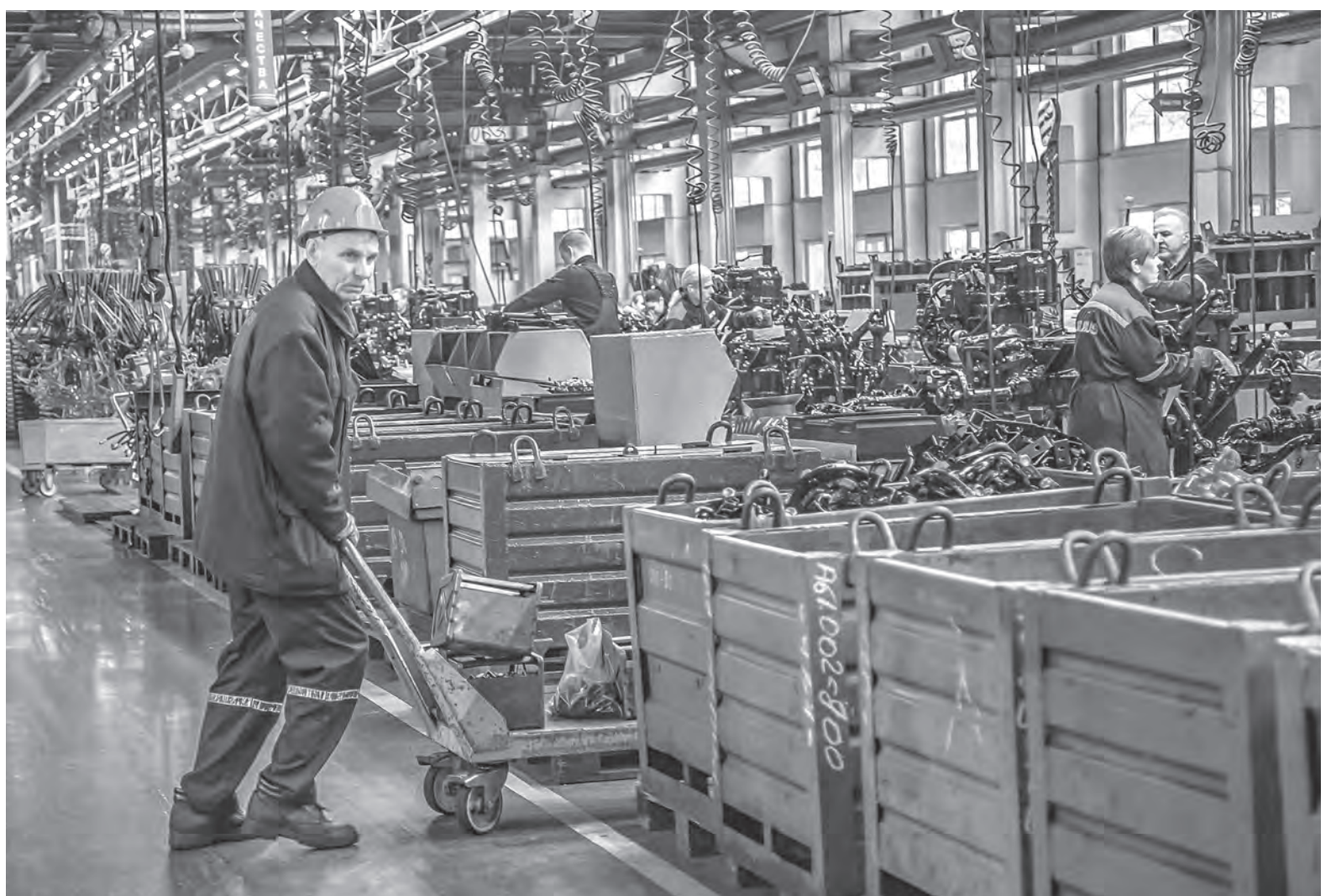
За каждый час работы в выходные дни сверх зарплаты, начисленной за указанное время, производится доплата либо с согласия работника ему может предоставляться другой неоплачиваемый день отдыха (ст.69 ТК). Фото носит иллюстративный характер.

Подготовила Наталья КОВАЛЕВА