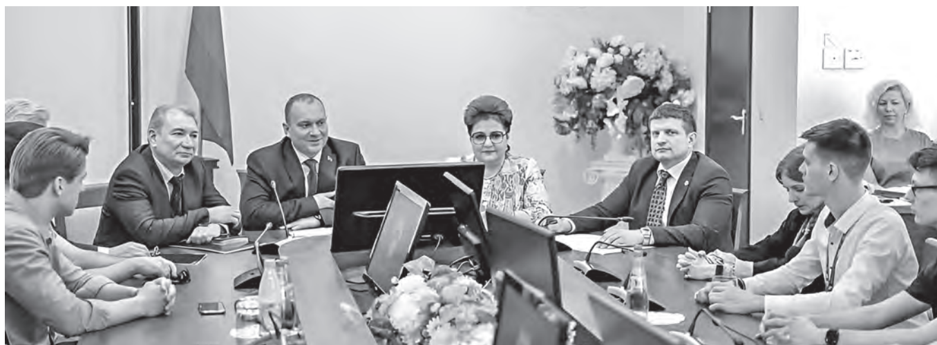
Молодежь Белхимпрофсоюза интересовали перспективы развития предприятий, реализация инвестпроектов, создание рабочих мест.