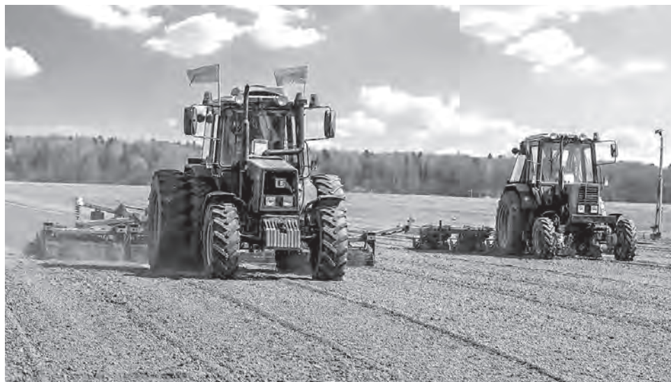
Амбициозные задачи на 2024 год: нужно производить порядка 10 млн. тонн зерна, 5 млн. тонн сахарной свеклы и более миллиона тонн рапса в год. На снимке сев кукурузы и сахарной свеклы в Гродненском районе.

Прибавлять можно и нужно, уверен Президент. «Поэтому задачи на 2024 год куда ам-