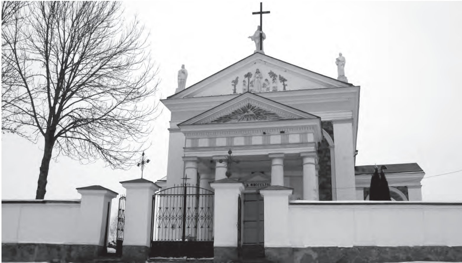
История местного католического храма тесно связана с родом Тизенгаузов.

В конце XIX века местечко перешло к Святополк-Четвертинским. В 1907 году они начали строить здесь свою резиденцию. Автором проекта был знаменитый польско-американский архитектор Владислав Маркони. Работы шли быстрыми темпами и уже спустя год завершились. Возведенный в стиле неobarock дворец представляет собой двухэтажное здание с мансардой и множеством окон. Даже сейчас, несмотря на запустение, выглядит впечатляюще, над парадным входом сохранился родовой герб.