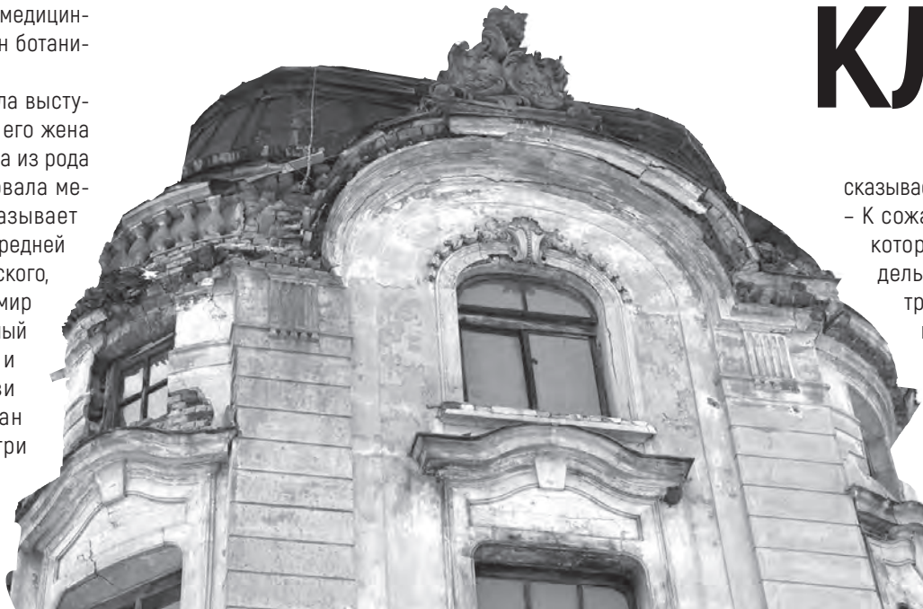
Во дворце над входом сохранился родовой герб Святополк-Четвертинских.