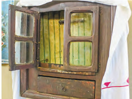
Старообрядческому шкафу для икон, который хранится в историко-этнографическом музее Миор, около 150 лет.