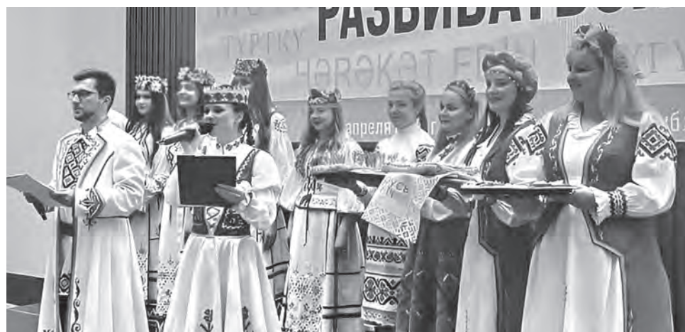
Команда Беларуси поделилась не только опытом работы, но и национальными традициями.

– Наша команда, а это 11 молодых педагогов из всех регионов страны, сделала акцент на направлениях молодежной политики, мотивации и вовлечении молодых людей в активную