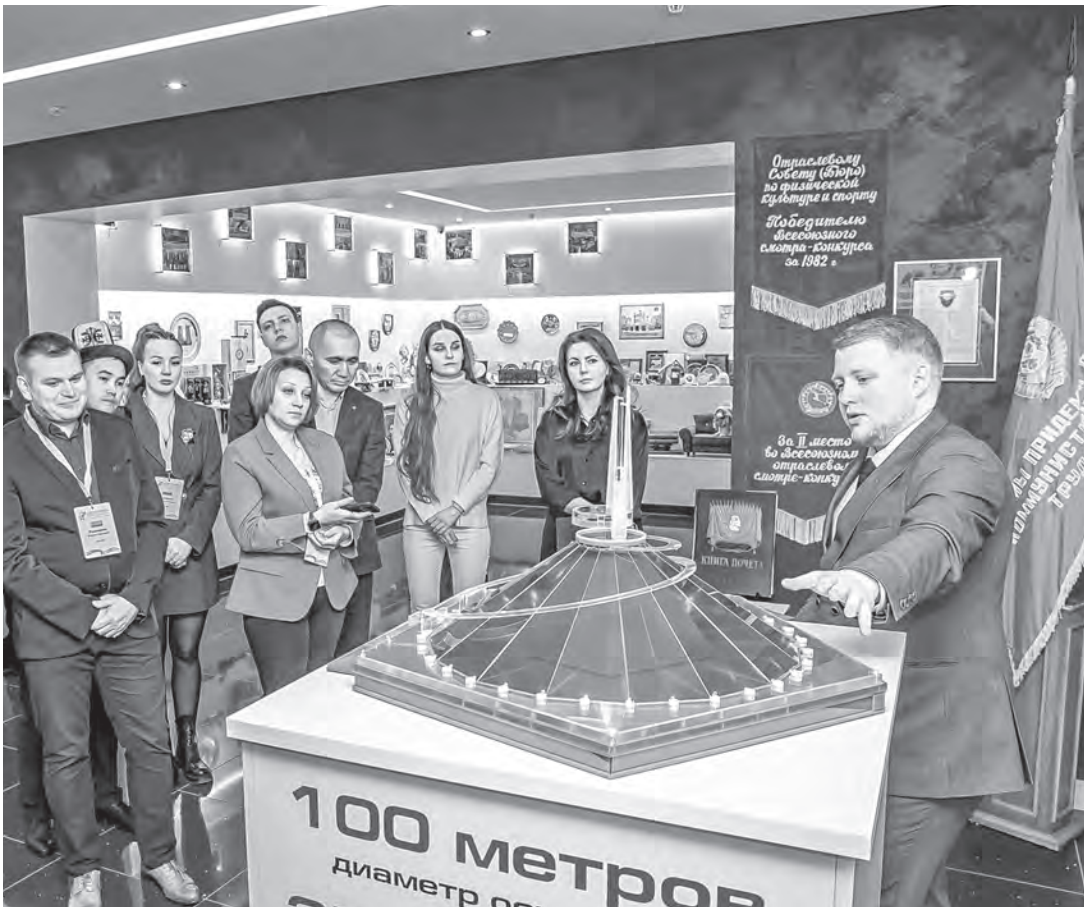
Участники «Маршрута добрых дел» посетили экспозиционно-выставочный центр ФПБ.

К благоустройству воинских захоронений на территории нашей страны подключились молодые профактивисты России, Кыргызстана и Узбекистана: по инициативе Белорусского профсоюза работников здравоохранения проходит акция «Маршрут добрых дел».