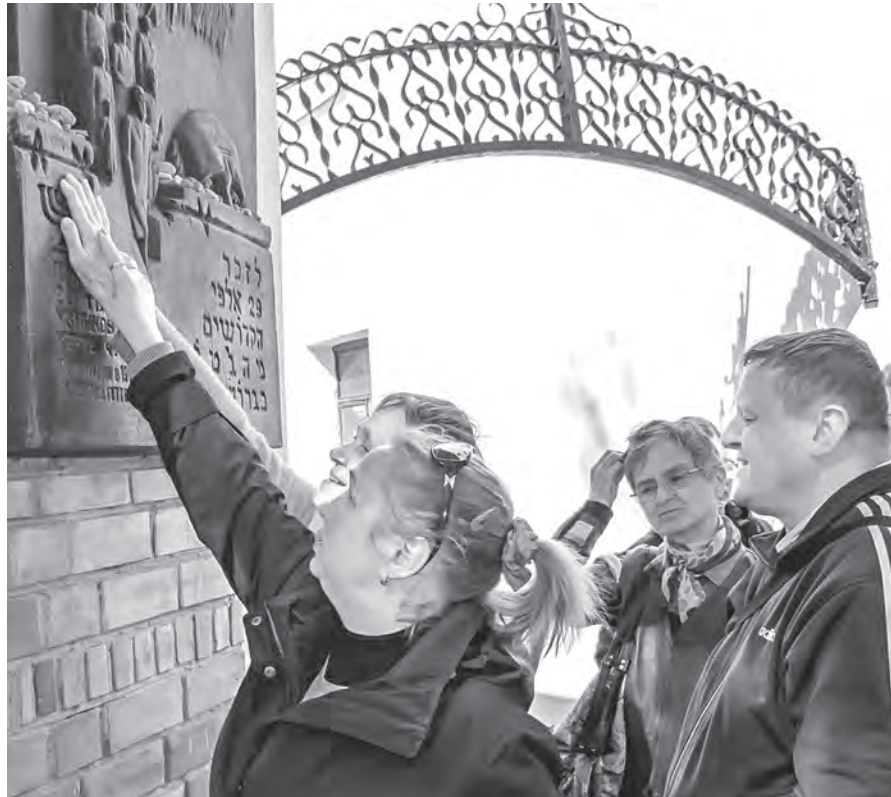
Тактильные экскурсии помогают слабовидящим гродненцам лучше узнать свой город.