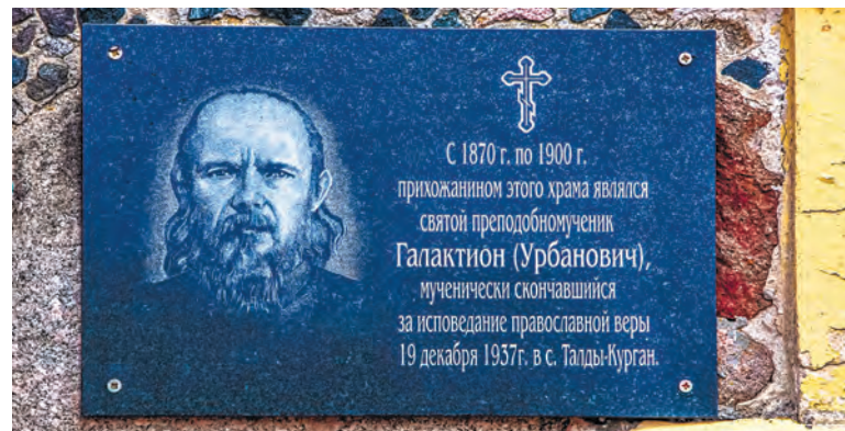
Мемориальная доска у входа в церковь установлена в 2017 году.