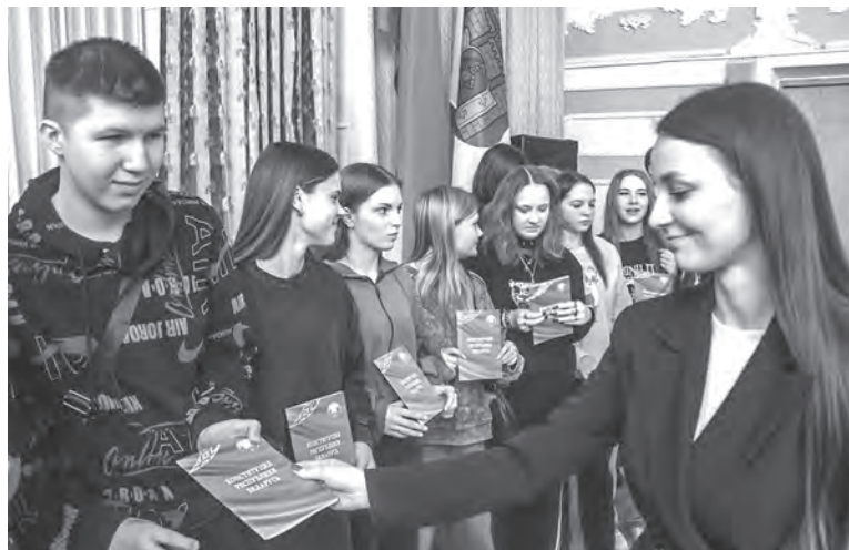
Торжественное вручение книги «Конституция Республики Беларусь» учащимся Могилевского колледжа сферы обслуживания.

В Бресте профсоюзная акция «Изучаем Конституцию Республики Беларусь» собрала молодых профактивистов со всей области. Говорили об историческом пути конституционного развития страны, правовых аспектах деятель-