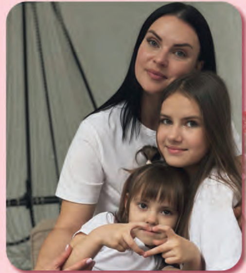
Автор фото: Карина Панкратенкова, Витебск

ПОДРОБНОСТИ КОНКУРСА НА BELCHAS.1PROF.BY